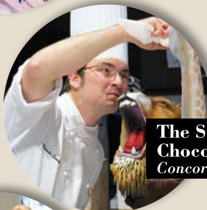
The Star of Chocolate Concorso Internazionale