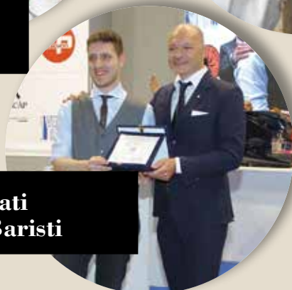
Campionati Italiani Baristi