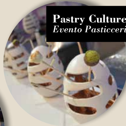
Pastry Culture Evento Pasticceria