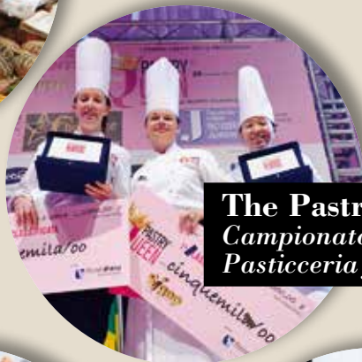
The Pastry Queen Campionato Mondiale Pasticceria femminile