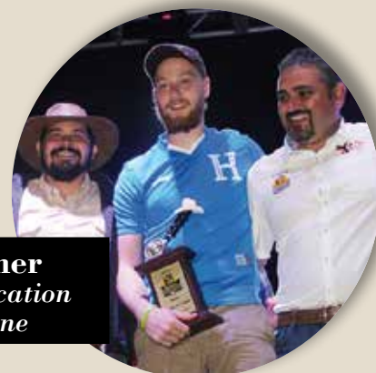
Barista&Farmer Progetto di Education nei paesi di Origine