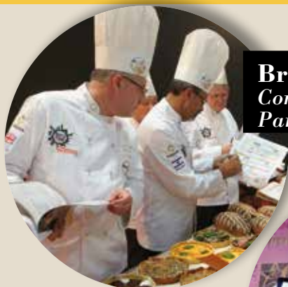
Bread in the City Concorso Internazionale Panificazione