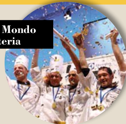
Coppa del Mondo della Gelateria