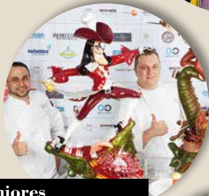
Seniores Campionato Italiano Pasticceria