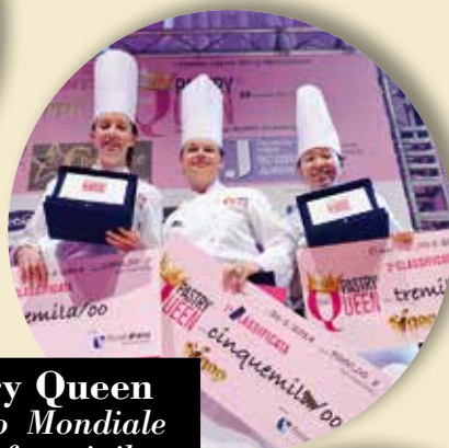
The Pastry Queen Campionato Mondiale Pasticceria femminile