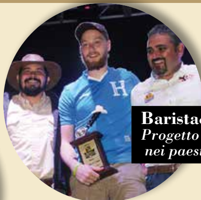
Barista&Farmer Progetto di Education nei paesi di Origine