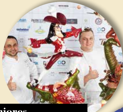
Seniores Campionato Italiano Pasticceria