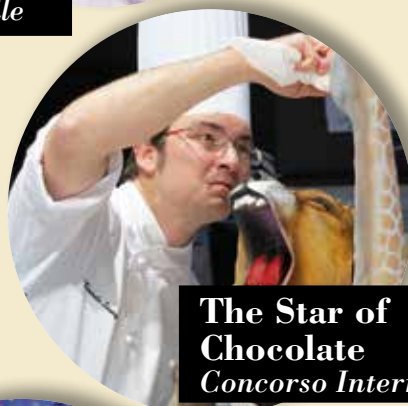
The Star of Chocolate Concorso Internazionale