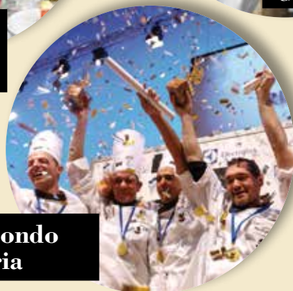
Coppa del Mondo della Gelateria