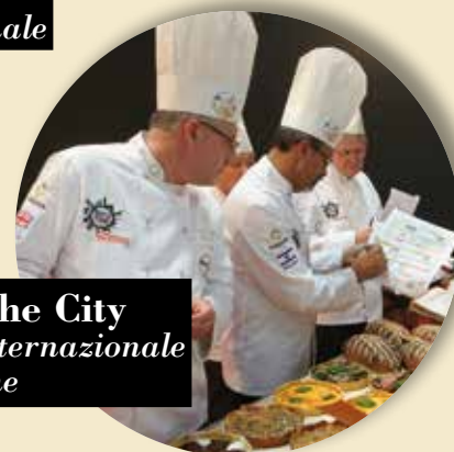
Bread in the City Concorso Internazionale Panificazione