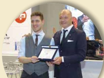
Campionati Italiani Baristi