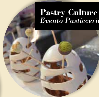
Pastry Culture Evento Pasticceria